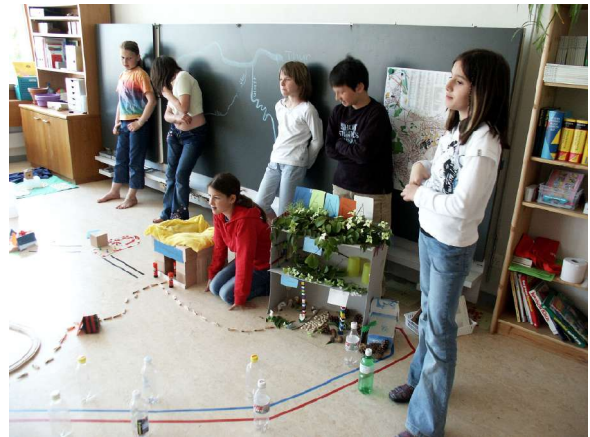
Blick auf einen Wohnblock...

Die Kinder hatten alles aus verschiedenen Materialien zusammengestellt, geklebt, gemalt und und und. In verschiedenen Gruppen eingeteilt, waren sie zuständig, in der entstehenden Gemeinde, einen Infrastrukturbereich zu übernehmen. Sie gestalteten schöne Werke, wie zum Beispiel den umweltbewussten Bau der Benninger oder ein neues Fussballstadion in der Rüti bei Henau, wie auch einen Freizeitpark, alles eben nach Wunsch. Für die Tiere baute man einen Wildpark. Jeder durfte machen, was ihm gefällt. Es kamen interessante Dinge heraus.