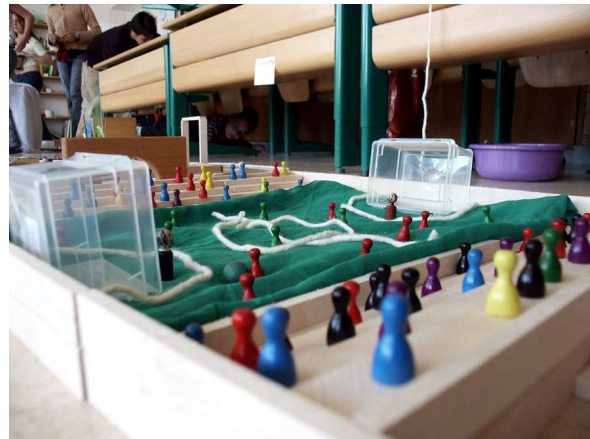
Das Stadion in der Rüti...