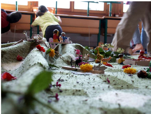
Der Freizeit- und Wildpark...